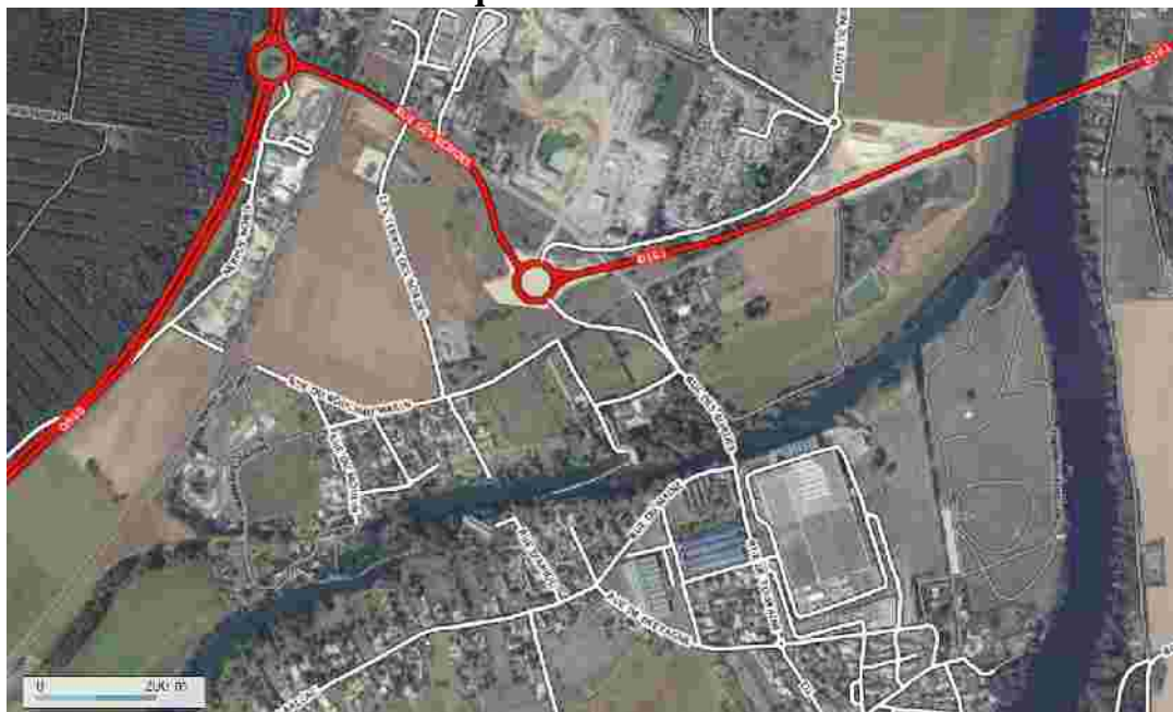
Plan de la Pointe de Forclan à Cenon-sur-Vienne